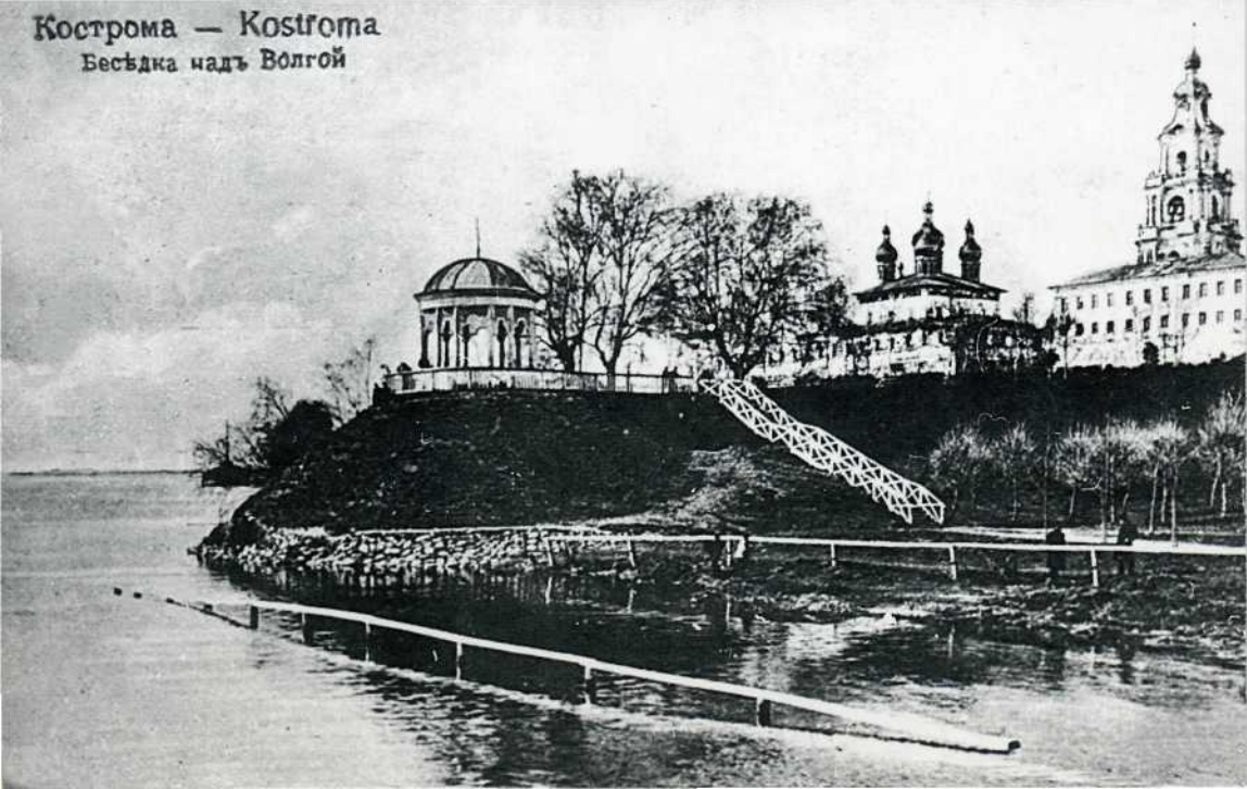
Кострома — Kostroma Бесѣдка надъ Волгой