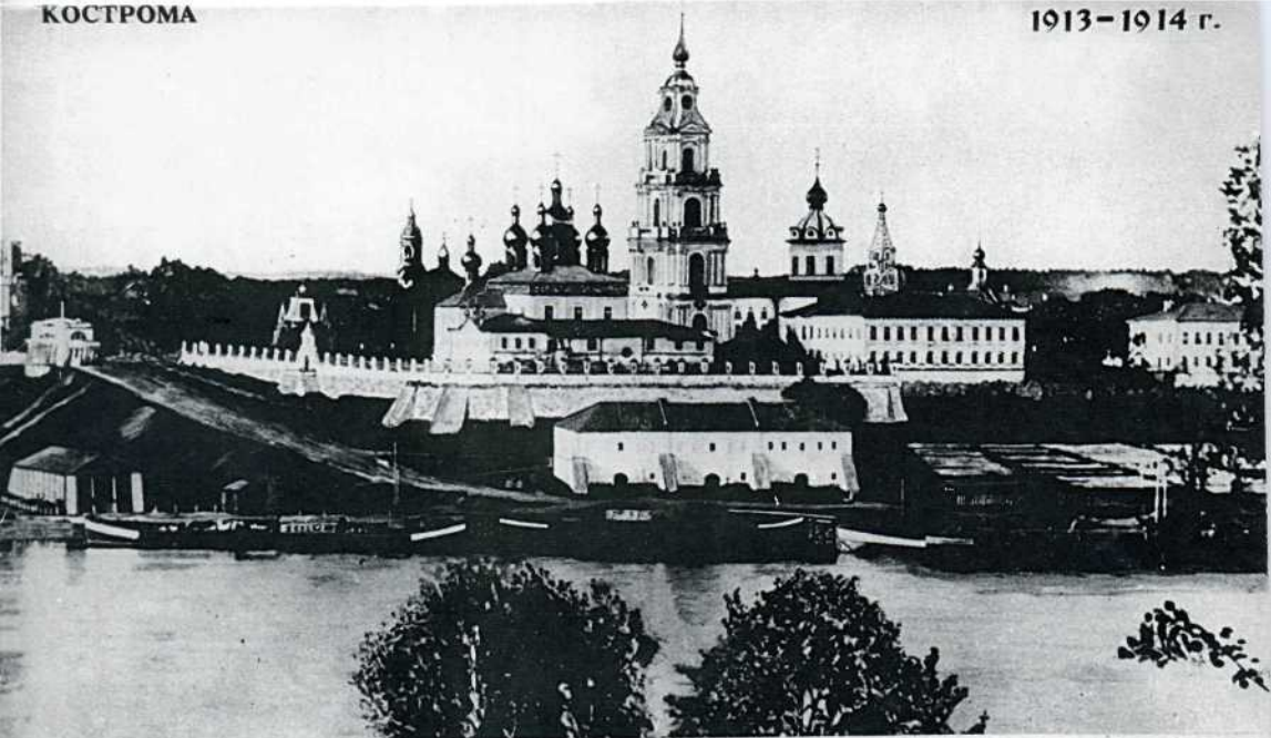
СОБОРНЫЙ АНСАМБЛЬ Соборный ансамбль был взорван в 1934 году. Слева от ансамбля можно видеть Царскую беседку и строящийся памятник в честь 300-летия Дома Романовых.